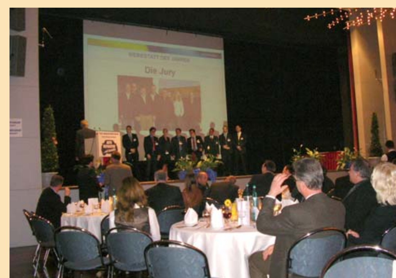
Preisverleihung im Goldsaal der Westfalenhalle Dortmund.